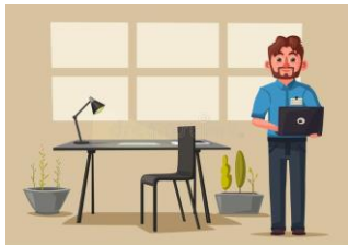
servizi per l'ufficio